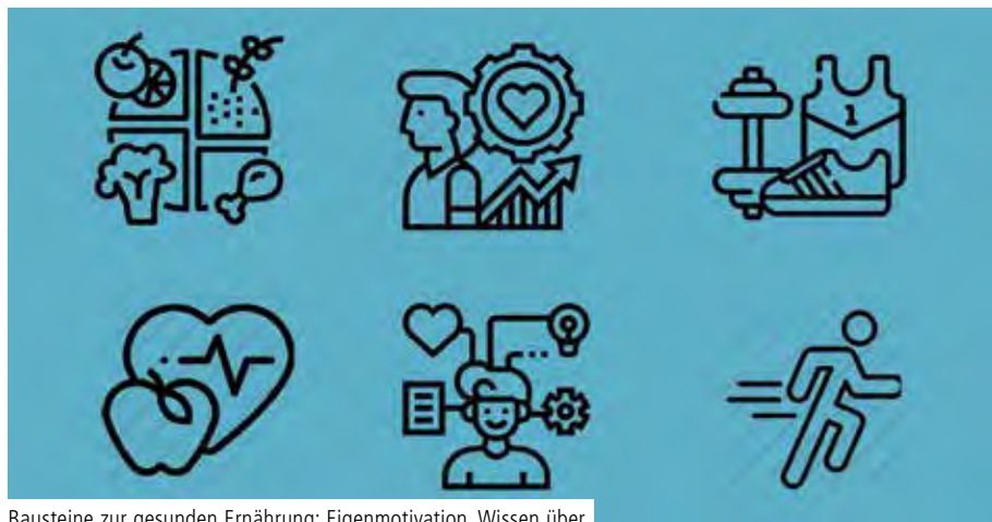
Bausteine zur gesunden Ernährung: Eigenmotivation, Wissen über Nahrungsmittel, Bewegung und tatsächliche Ernährung Grafik: Höse

Stefanie Amler unterstützt Patientinnen und Patienten zur gesunden Ernährung