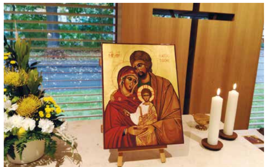
Die Ikone zeigt Jesus, Maria und Joseph, den Patron des St. Joseph-Krankenhauses