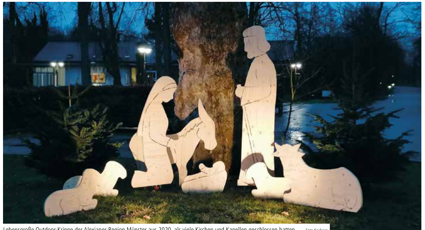
Lebensgroße Outdoor-Krippe der Alexianer-Region Münster aus 2020, als viele Kirchen und Kapellen geschlossen hatten

Beim Strategieprozesses 2025 hat die Umsetzung begonnen. Die Alexianer haben sich mit Beginn des Jahres strukturell neu aufgestellt: In den obersten beiden Gremien – Stiftungskuratorium und Aufsichtsrat – haben wir neue Mitglieder begrüßen dürfen. Die Führungsstruktur des Unternehmens wurde durch die Erweiterung der Hauptgeschäftsführung und die