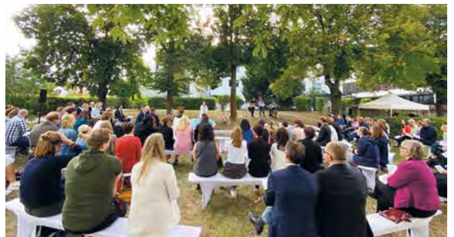
Während des Gottesdienstes zwischen der historischen Villa und dem modernen Hauptgebäude

Die Alexianer St. Hedwig Kliniken zählen mit ihren Häusern, dem St. Hedwig-Krankenhaus und dem Krankenhaus Hedwigshöhe, zu den beliebtesten Allgemeinkrankenhäusern der Hauptstadt. Sie bieten auf mehreren Gebieten Spitzenmedizin und belegen seit vielen Jahren vordere Plätze in landes- und bundesweiten Krankenhausrankings. Pünktlich zum Jubiläumsjahr 2021 wurden die St. Hedwig Kliniken Berlin vom Magazin Newsweek gar mit dem Siegel „World bests Hospitals“ ausgezeichnet. ✓ (stm)