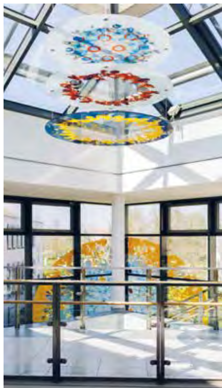
Wechselt der Betrachter den Standort, werden die einzelnen Schichten sichtbar. Die Gestaltung lädt zum Perspektivwechsel ein