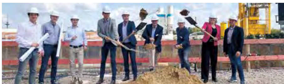
Mit dem symbolischen Spatenstich haben die Bauarbeiten für den Neubau der Alexianer Zentralschule für Gesundheitsberufe am Dreieckshafen offiziell begonnen

Bereits zu Beginn der Sommerferien war die Baustelle eingerichtet worden, die nun für zwei Jahre das Bild am Dreieckshafen bestimmen wird. Auf der rund 4.000 Quadratmeter