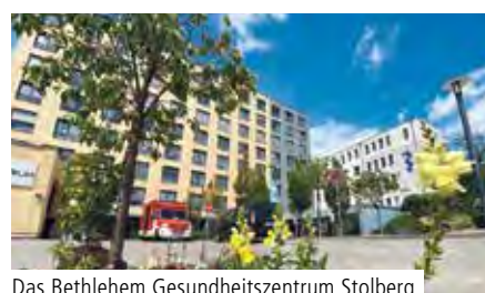
Das Bethlehem Gesundheitszentrum Stolberg