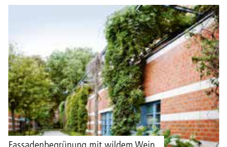
Fassadenbegrünung mit wildem Wein, Klettergurke und Clematis

ranken sich wilder Wein, Klettergurke und Clematis empor. Vor dem Hauptgebäude des Krankenhauses schlagen Magnolienbäume und alte Douglasien ihre Wurzeln. Ursprünglich gründeten die Alexianerbrüder das Krankenhaus im Jahr 1893 und betrieben dort einen Bauernhof. Als Selbstversorger nutzten die Brüder ihre Ernte zum Beispiel für eine eigene Bäckerei. Es gelang ihnen damals, den Bedarf des Krankenhauses vollständig zu decken. Die durch den