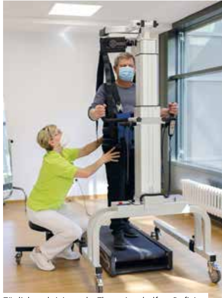
Tägliche aktivierende Therapien helfen Defizite schnellstmöglich nach dem Akutereignis zu überwinden

„Die neurologische Frührehabilitation der Phase B ermöglicht noch in der Zeit der akuten stationären Krankenhausbehandlungsnotwendigkeit den unmittelbaren Beginn aktivierender Therapien, um frühestmöglich die