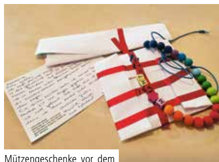
Mützenschenke vor dem Versand