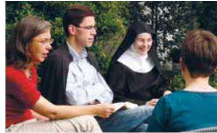
Auseinandersetzung mit Glauben und Spiritualität in der Benediktinerinnen-Abtei Varenzell