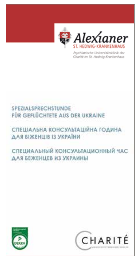
Titelblatt des Flyers der Spezialsprechstunde für Geflüchtete

Spendenkonto Alexianer GmbH: Kontoinhaber: Alexianer St. Hedwig Kliniken Berlin GmbH Kreditinstitut: Pax-Bank eG IBAN: DE49370601936000650100 BIC: GENODED1PAX Spendenkennwort: Hilfe Ukraine