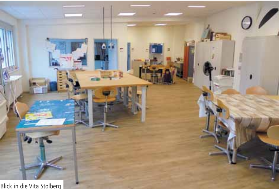
Blick in die Vita Stolberg

Seit dem 1. März 2020 gibt es im Wohn- und Beschäftigungsverbund neben der Vita Alsdorf eine zweite „neue“ Vita, die Vita Stolberg. Beides sind Einrichtungen für Tagesstruktur, Ergo- und Arbeitstherapie.