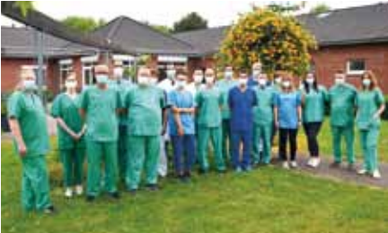
„Buntes“ Team der psychiatrischen Isolierstation auf Zeit

KREFELD. Während des bisherigen Höhepunktes der Corona-Krise wurde kurzfristig ein „buntes“ Team für den Betrieb einer Isolierstation für Psychiatriepatienten zusammengestellt. Die Kolleginnen und Kollegen mussten sich von einem Tag auf den anderen auf völlig neue Bedingungen einstellen. Sie meisterten die Belastungen und erlebten eine sehr erkenntnisreiche Zeit der Zusammenarbeit. ✕ (fj)