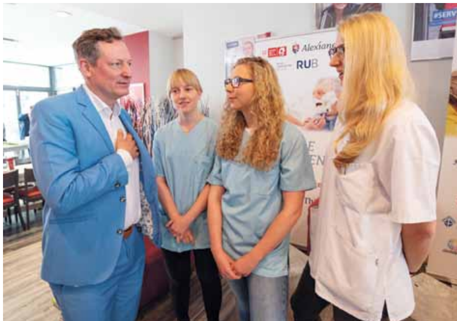
Mit Freude pflegen – für Eckart von Hirschhausen ein besonderes Anliegen

MÜNSTER. Mit „Freude pflegen“ – das innovative Unterrichtskonzept zum Stressmanagement und zur langfristigen Erhaltung der Motivation für Pflegeauszubildende – wird derzeit in einer Langzeitstudie von Eckart von Hirschhausens Stiftung „HUMOR HILFT HEILEN“, der Ruhr-Universität Bochum und von den Alexianern wissenschaftlich untersucht. Nach einer ersten halbjährigen Erprobungsphase können bereits vielversprechende Ergebnisse aufgezeigt werden.