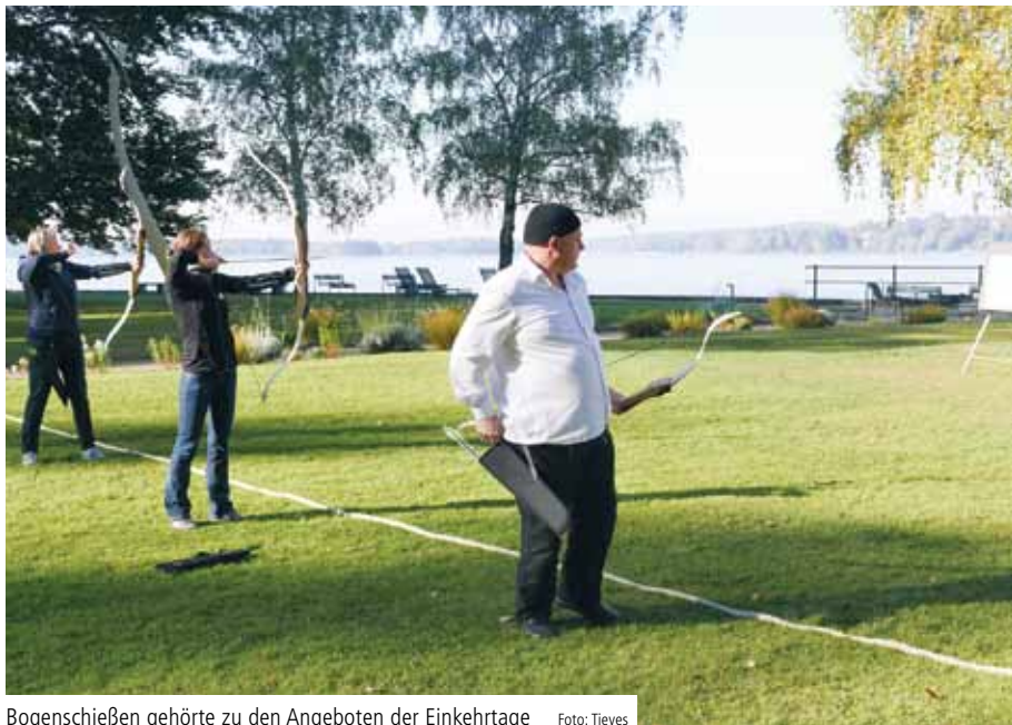
Bogenschießen gehörte zu den Angeboten der Einkehrtage

BERLIN. Zum sechsten Mal fanden unter dem Motto „Wir sind dann mal weg!“ die Einkehrtage für Führungskräfte des Alexianer St. Joseph-Krankenhauses Berlin-Weißensee statt.