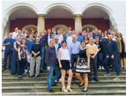
Gäste der Jubiläumsfeier vor der Villa