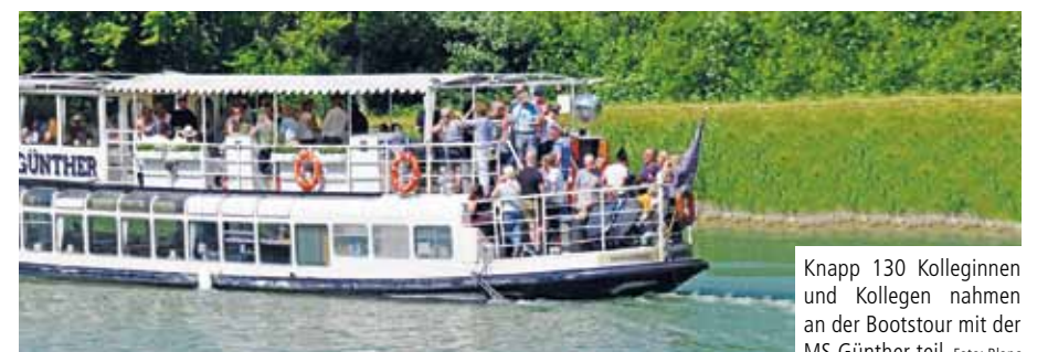
Knapp 130 Kolleginnen und Kollegen nahmen an der Bootstour mit der MS Günther teil