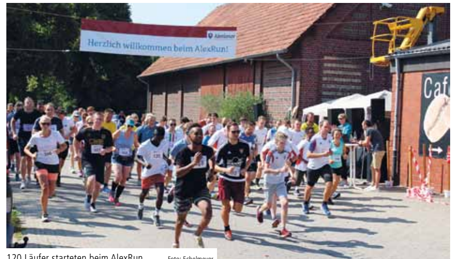
120 Läufer starteten beim AlexRun

Schwitzen und Laufen macht zusammen mehr Spaß!