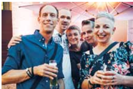
Ein entspannter Abend für die Kolleginnen und Kollegen aus den Seniorenheimen und der Tagespflege, der Agamus, der Oberlinklinik, den Medizinischen Versorgungszentren (MVZ), dem Evangelischen Zentrum für Altersmedizin (EZA), dem St. Josefs-Krankenhaus und mit engen Potsdamer Kooperationspartnern ...

Das Mitarbeiterfest der gesamten Region Potsdam