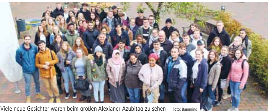
Viele neue Gesichter waren beim großen Alexianer-Azubitag zu sehen

MÜNSTER. Gleich zwei große Veranstaltungen für neue junge Kollegen fanden im Herbst 2019 in Münster statt. Mit dem Alex-Starter-Forum geht die Region Münster zukünftig neue Wege: Vier gemeinsame Treffen mit Auszubildenden im ersten Ausbildungsjahr, FSJlern und Praktikanten werden als feste Größe im Ausbildungs- und Einarbeitungsplan für Nachwuchskräfte der Alexianer etabliert. Die Veranstaltungen finden im Rahmen der Arbeitszeit statt.