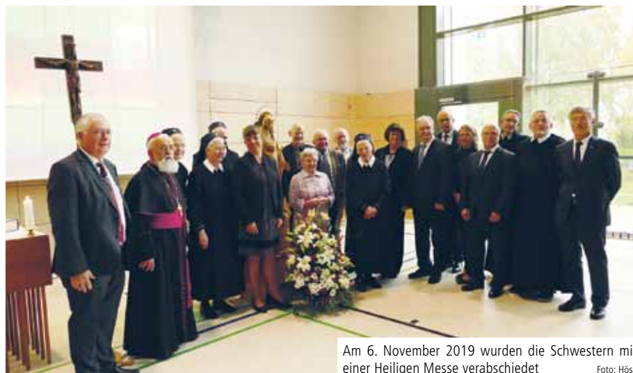
Am 6. November 2019 wurden die Schwestern mit einer Heiligen Messe verabschiedet

Die Schwestern prägten über viele Jahre das christliche Bild der Klinik. „Durch die Schönstätter Marienschwestern konnten Menschen Gott