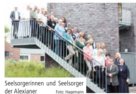
Seelsorgerinnen und Seelsorger der Alexianer

Im Vordergrund des diesjährigen Fortbildungsteils stand das Thema Indikationen für die Seelsorge. Das Wort Indikation ist im Gesundheitswesen bekannt. Es bezeichnet den Grund für die Anwendung einer diagnostischen oder therapeutischen Maßnahme im Fall von Krankheit. Dieser Grund muss die Maßnahme rechtfertigen und der Erkrankte muss darüber aufgeklärt sein sowie eingewilligt haben. Auch für den Bereich der Seelsorge gibt es die Idee, dass Indikationen für ihre Kontaktierung definiert werden. In der Schweiz wird bereits mit einem Indikatoren-Set