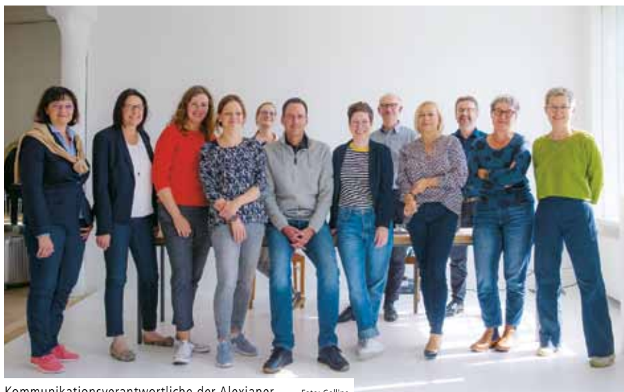
Kommunikationsverantwortliche der Alexianer

Auf der Agenda der Kommunikator/innen-Konferenz stand das große Thema Marke – oder: Tue Gutes und rede darüber. Die Marke eines Unternehmens ist ein wichtiges Unterscheidungsmerkmal im Wettbewerb, insbesondere um qualifizierte Fachkräfte. Die Alexianer möchten sich, ihre Werte und Leistungen professionell, modern