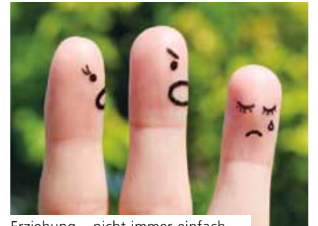
Erziehung – nicht immer einfach...