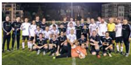
In den offiziellen Trikots der Deutschen Fußballnationalmannschaft bestreitet der FC Bundestag bis zu 20 Fußballspiele pro Jahr. Im September 2019 waren die Kicker der Alexianer zu Gast

Mit einem 3:1 Sieg verabschiedeten sich die Fußballer der Alexianer Werkstätten aus Münster gegen den FC Bundestag in die dritte Halbzeit: Im Kesselhaus, der Cafeteria des St. Hedwig-Krankenhauses in Berlin, wurde nach dem packenden Match gemeinsam gegessen, gefachsimpelt und auch direkt ein Rückspiel vereinbart.