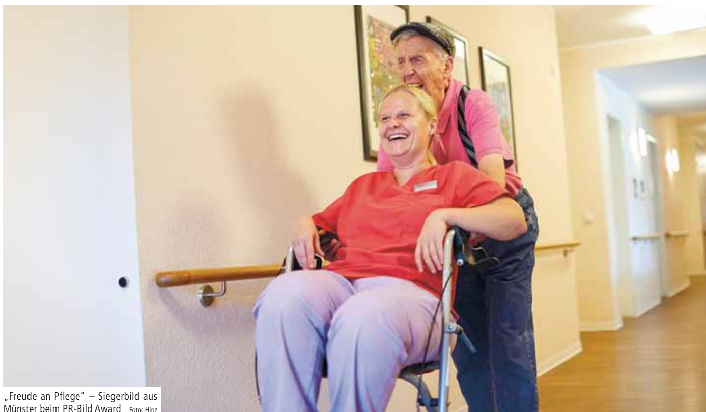
„Freude an Pflege“ – Siegerbild aus Münster beim PR-Bild Award

Die Alexianer sagen: Herzlichen Glückwunsch zu dieser bedeutenden Auszeichnung! ✕ (ce)