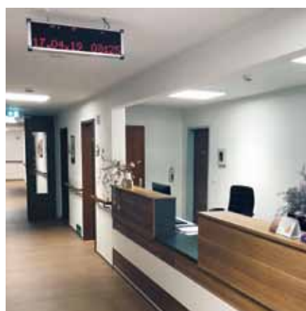
Die neugeschaffenen Pflegestützpunkte sind ein attraktiver Blickfang.

Zudem entstanden durch die Öffnung der Stationszimmer attraktive, in den