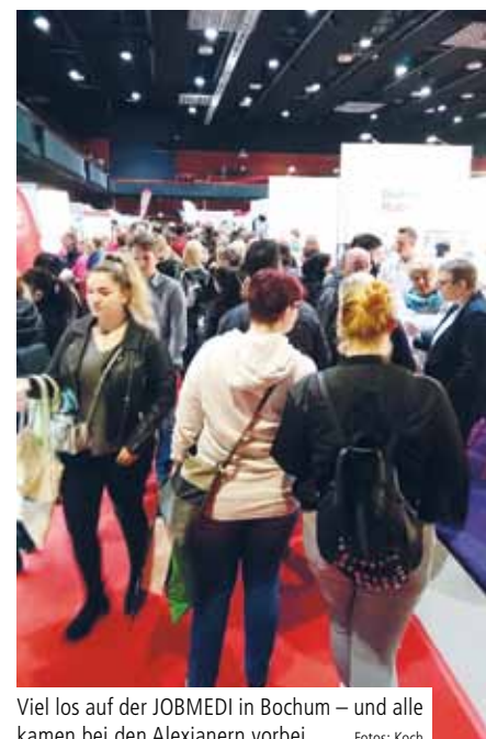
Viel los auf der JOBMEDI in Bochum – und alle kamen bei den Alexianern vorbei

Das führende deutsche Branchentreffen in Berlin bot an drei Veranstaltungstagen zahlreiche neue Konzepte, Ideen und Impulse aus oder für den Bereich Pflege. Rund 10.000 Interessierte besuchten die Fachausstellung sowie diverse Vorträge. Am Stand der Alexianer war das Interesse an Arbeitsplatzmöglichkeiten groß.