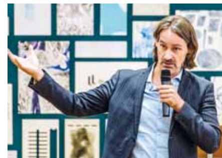
Philosoph und Bestsellerautor Prof. Dr. Richard David Precht gab den 160 Kinder- und Jugendexperten wertvolle Impulse

Und das konnte in diesem Jahr nicht nur mit einem erneut vielfältigen Programm, sondern – zum kleinen Jubiläum – auch mit einem prominenten Gastredner aufwarten: Philosoph und Bestsellerautor Professor Dr. Richard David Precht unternahm in spannenden 75 Minuten zur „Entwicklung des ‚Ichs‘ im modernen sozialen Umfeld“ einen eindrucksvollen Streifzug durch die Philosophie und gab den Experten mit seinem Vortrag viele wert-