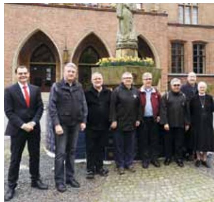
Im Innenhof des Alexianer St. Hedwig-Krankenhauses

Am Nachmittag stand das Alexianer Krankenhaus Hedwigshöhe auf dem Programm. Nach einem gemeinsamen Kaffeetrinken mit Vertretern der Hausleitung, der Seelsorge und den Chefärzten, in dem die Brüder durch zahlreiche Fachfragen ihr Interesse zum Ausdruck brachten, schloss sich eine Hausbesichtigung an, die mit einem gemeinsamen Vaterunser in der Krankenhauskapelle endete.