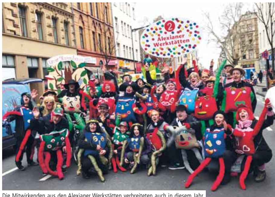
Die Mitwirkenden aus den Alexianer Werkstätten verbreiteten auch in diesem Jahr wieder viel gute Laune auf dem Schull- un Veedelszöch.

Auch in diesem Jahr waren die Alexianer Werkstätten in Köln mit einer bunten Fußtruppe beim legendären Schull- un Veedelszöch vertreten.