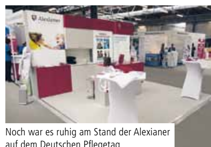
Noch war es ruhig am Stand der Alexianer auf dem Deutschen Pflorgetag

BERLIN/BOCHUM. Die Pflegebranche steht – bedingt durch Personalmangel und schwierige Arbeitsbedingungen – vor extremen Herausforderungen. Der demografische Wandel mit steigender Lebenserwartung bei gleichzeitig sinkender Geburtenrate wird diese Probleme noch verschärfen. Umso wichtiger ist es den Alexianern, sich als guter Arbeitgeber zu präsentieren. Wie zum Beispiel als Aussteller auf dem Deutschen Pflorgetag in Berlin und auf der JOBMEDI in Bochum.