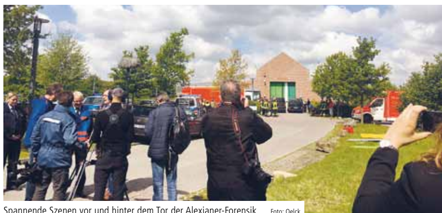
Spannende Szenen vor und hinter dem Tor der Alexianer-Forensik

Großlage-Szenario in der forensischen Christophorus Klinik