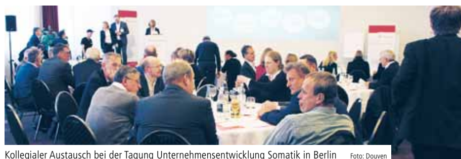
Kollegialer Austausch bei der Tagung Unternehmensentwicklung Somatik in Berlin

BERLIN. Zu diesem spannenden strategischen Thema trafen sich Anfang April 2019 in Berlin die Führungskräfte der somatischen Kliniken des Alexianer-Verbundes zur Tagung Unternehmensentwicklung Somatik.