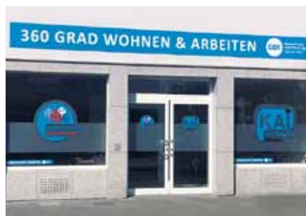
Neue Räume für ambulante Dienste

Am 4. Februar 2019 haben die beiden ambulanten Dienste des Verbundunternehmens der Alexianer Werkstätten GmbH, der Gemeinnützigen Werkstätten Köln (GWK) „Köln arbeitet inklusiv“ und Betreutes Wohnen (BeWo), ihre neuen Räume in der Longeicher Straße 441 bezogen.