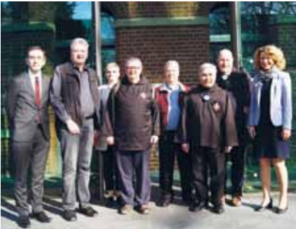
Vor dem Hauptportal des Alexianer St. Joseph-Krankenhauses

Bruder Lawrence Krueger, der Generaloberer der Ordensgemeinschaft der Alexianerbrüder, besuchte zusammen mit Mitbrüdern am 4. und 5. April 2019 die drei Berliner Standorte