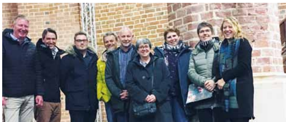
Die Pflegedirektorinnen und Pflegedirektoren und ihre leitenden Mitarbeiter kamen am 19. und 20. März 2019 zur Tagung im St. Joseph-Krankenhaus Dessau zusammen. Die Führungskräfte tauschten sich über den aktuellen Stand der Pflege in ihren Häusern aus und besprachen unter anderem das Pflegestärkungsgesetz und die strategische Pflegeplanung. Bei einem Stadtrundgang lernten sie die Bauhausstadt Dessau kennen