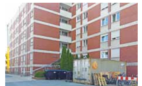
Noch stehen Bau-Container vor dem Wohnheim an der Piusallee, im September wird das Projekt dann abgeschlossen sein.

Das fünfgeschossige Gebäude aus dem Jahr 1972 war deutlich in die Jahre gekommen. Nicht nur die 110 Zimmer mussten renoviert werden, auch die komplette Installationstechnik und das Dach wurden saniert, die Fenster isoliert, es gab komplett neue Bäder und die Aufzugsanlage wurde ausgetauscht. „Die Zufriedenheit der Mitarbeiterinnen und Mitarbeiter ist