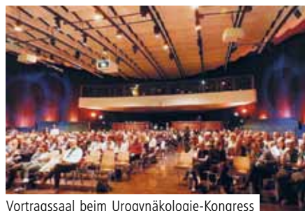
Vortragssaal beim Urogynäkologie-Kongress

BERLIN. Am 22. und 23. März 2019 haben Experten aus den Bereichen Frauenheilkunde, Urologie und Physiotherapie im ehemaligen Berliner Kino Kosmos am Deutschen Urogynäkologie-Kongress teilgenommen.