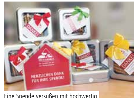
Eine Spende versüßen mit hochwertig verpacktem Gebäck

MÜNSTER. Die Idee kam von den Münsteraner Landfrauen: Wer Geld spendet, bekommt Gebäck. Hübsch aufbereitet und hochwertig verpackt. Mit der tatkräftigen Unterstützung der Friseurinnung und aller Münsteraner Lion Clubs sollten somit an großzügige Spender und Spenderinnen süße Knabberereien in edlen Metall Dosen vergeben werden.