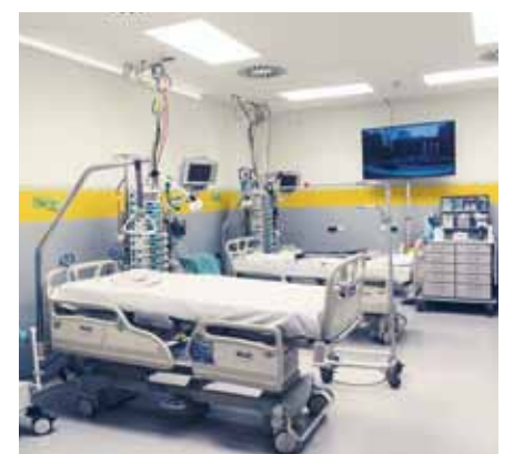
Patientenzimmer im Container

Nach langen Überlegungen, wie sich eine ITS bei laufendem Betrieb umbauen lässt, wurde sie kurzerhand temporär in den ehemaligen, noch nicht abtransportierten OP-Container verlegt. Herausforderungen hierbei waren die gewohnte Kons-