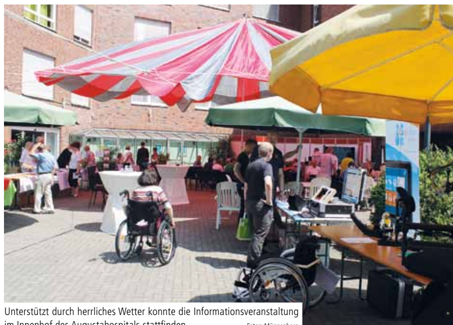
Unterstützt durch herrliches Wetter konnte die Informationsveranstaltung im Innenhof des Augustahospitals stattfinden