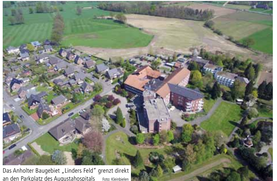
Das Anholter Baugebiet „Linders Feld“ grenzt direkt an den Parkplatz des Augustahospitals

Einen ausführlichen Bericht zu den Projekten finden Sie im Mantelteil dieser Ausgabe („Aus dem Verbund“). ✓ (mü)