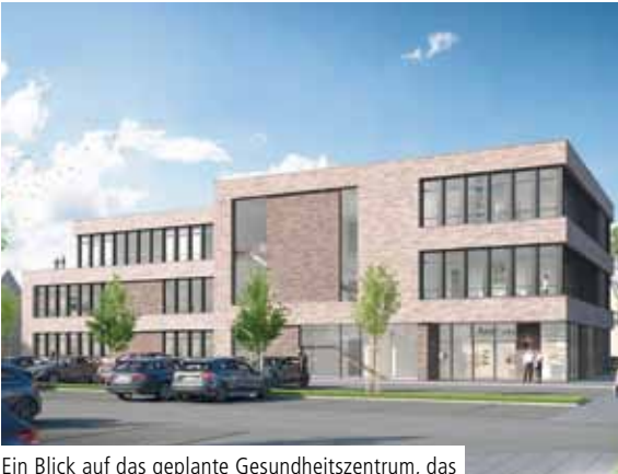
Ein Blick auf das geplante Gesundheitszentrum, das Ende 2020 fertiggestellt werden soll.

Alexianer Misericordia GmbH und Augustahospital Anholt planen Gesundheitszentrum und Servicewohnen