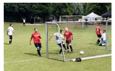
Das Runde muss ins Eckige. Tor der „Alexianer Kickers“ Krefeld (weiße Trikots) zum 2:1-Sieg gegen die St. Josefs-Kickers aus Potsdam

Laut unbestätigten Gerüchten kam es dabei zum unerlaubten Einsatz von Narkotika ... Krefeld gratuliert dem verdienten Sieger Clemenshospital Münster. ✗ (fj)