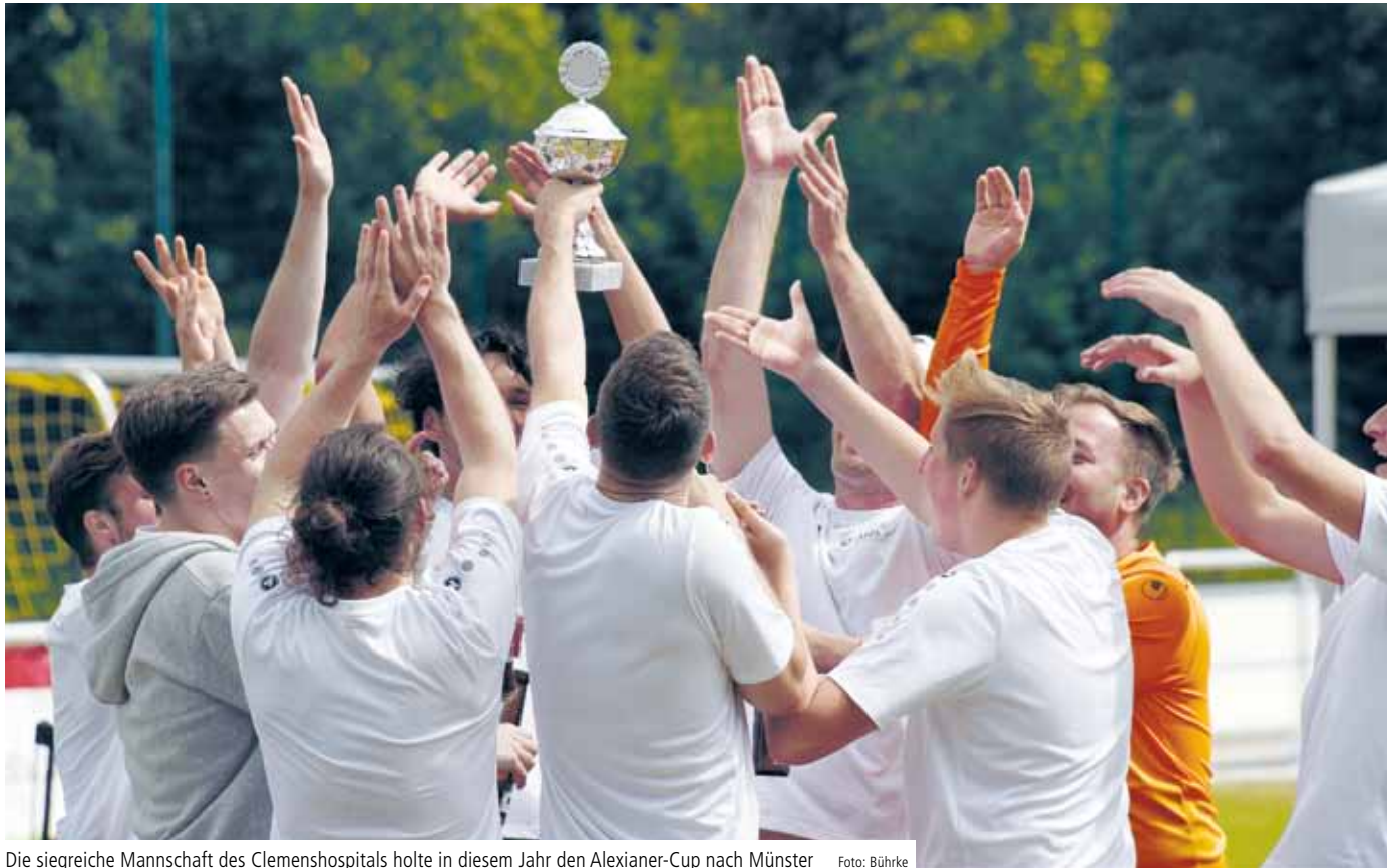
Die siegreiche Mannschaft des Clemenshospitals holte in diesem Jahr den Alexianer-Cup nach Münster

Alexianer-Cup bot den Zuschauern in Münster spannenden Fußball