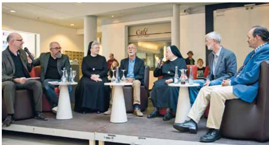
Während eines Podiumsgesprächs kamen Vertreter der Clemensschwwestern, Mitarbeiter und Gäste des Treffpunktes sowie Vertreter anderer sozialer Einrichtungen Münsters zu Wort