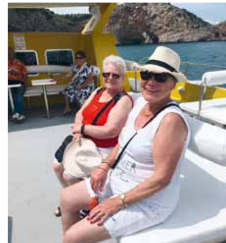
Nicht nur diese beiden Damen, die gesamte Reisegruppe des „Treff Aktiv“ genoss die Zeit in Spanien sichtlich

Grundsätzlich steht das Angebot allen an Demenz und Depressionen erkrankten Menschen zur Verfügung. Ein Mindestmaß an Mobilität und Gruppenfähigkeit sollte die Voraussetzung sein. In der Regel besteht die Möglichkeit, einen Teil der Kosten über die Pflege-