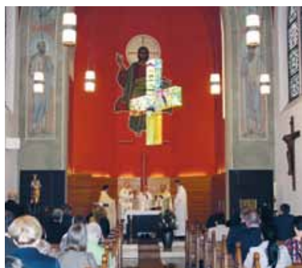
Festgottesdienst unter dem Lichtkreuz

Von der Heilanstalt für „gemüts- und nervenranke Herren“ zum modernen Zentrum für Neurologie, Psychiatrie, Psychotherapie und Psychosomatik