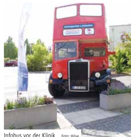
Infobus vor der Klinik.

WITTENBERG. Gemeinsam mit dem Schlaganfall Landesverband Sachsen-Anhalt e. V. richtete die Alexianer Klinik Bosse Wittenberg am 9. Mai 2018 einen Aktionstag gegen den Schlaganfall aus.