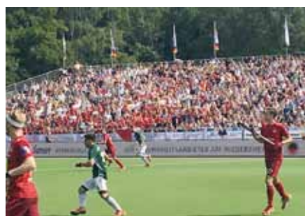
Ganz nah dabei: Die Alexianer Krefeld GmbH war Partner der Deutschen Feldhockey-Meisterschaft