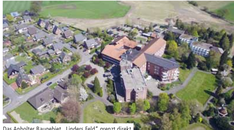
Das Anholter Baugebiet „Linders Feld“ grenzt direkt an den Parkplatz des Augustahospitals.