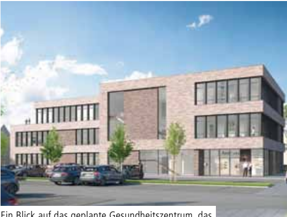
Ein Blick auf das geplante Gesundheitszentrum, das Ende 2020 fertiggestellt werden soll.

Alexianer Misericordia GmbH und Augustahospital Anholt planen Gesundheitszentrum und Servicewohnen