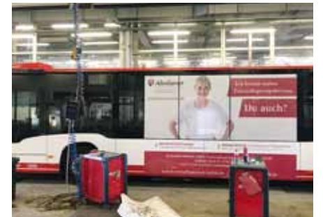
Mittels Folien auf den Bus geklebt: die mobile Botschaft für die Pflege und ihre vielfältigen Karriere-möglichkeiten

Krefelder Stadtbus wirbt für Krankenpflegeausbildung und duales Studium