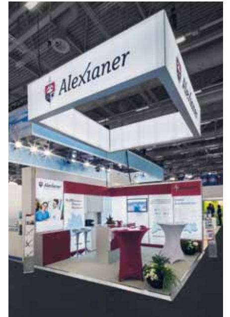
Mittendrin und schon von weitem gut sichtbar: der Stand der Alexianer auf dem HSK 2018.

BERLIN. Mit einem Teilnehmerrekord endete im Juni 2018 in Berlin der Hauptstadtkongress Medizin und Gesundheit (HSK).