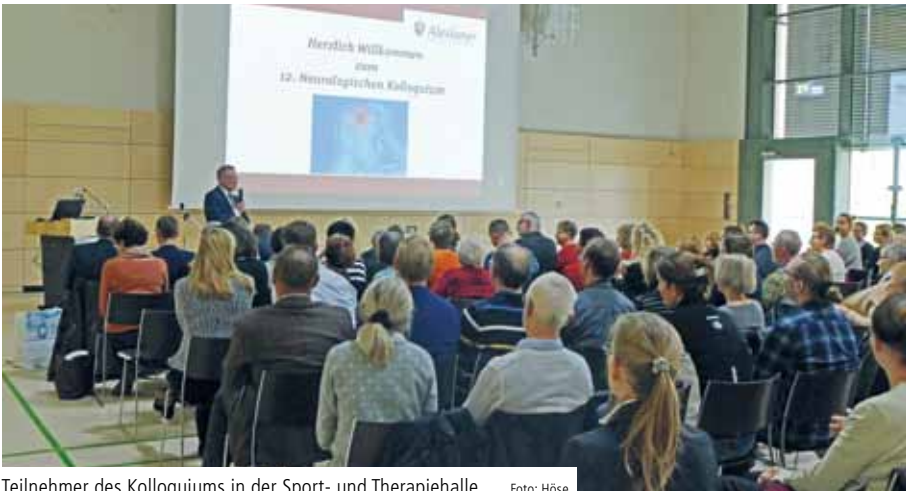
Teilnehmer des Kolloquiums in der Sport- und Therapiehalle

12. Wittenberger Neurologisches Kolloquium diskutierte rund um den Kopfschmerz