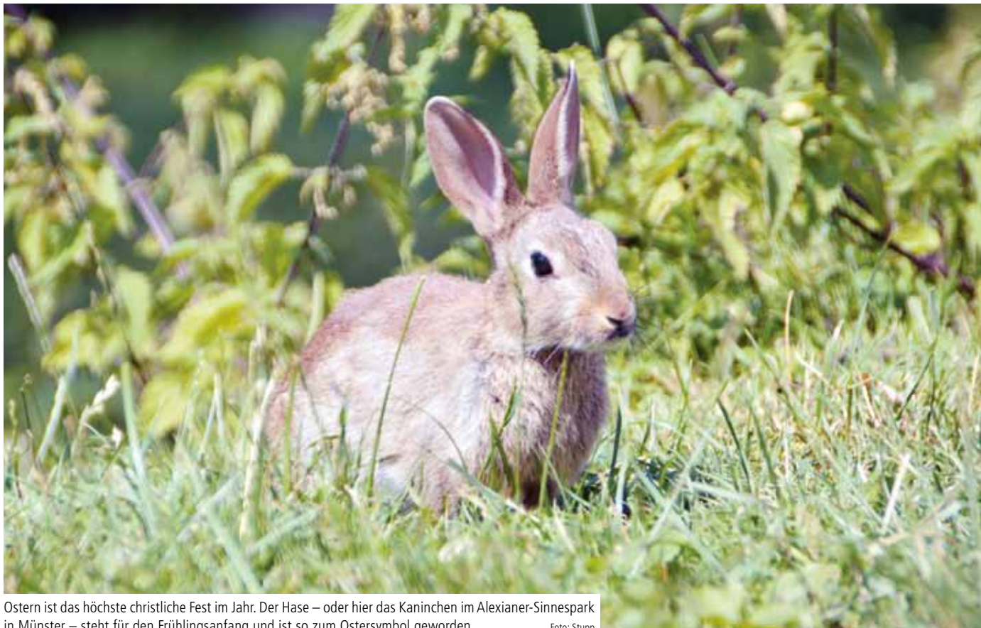
Ostern ist das höchste christliche Fest im Jahr. Der Hase – oder hier das Kaninchen im Alexianer-Sinnespark in Münster – steht für den Frühlingsanfang und ist so zum Ostereisymbol geworden