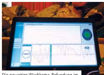
Die neuartige Wachkoma-Befundung im „Haus Christophorus“

„Durch fehlende Reaktionen ist es – je nach Ausmaß der Hirnschädigung –