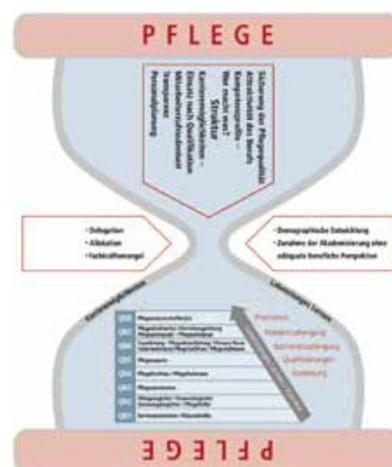
Das Kompetenzstufenmodell der Alexianer Grafik: Krause

Bereits jetzt arbeiten Serviceassistenten, Genesungsbegleiter, Pflegehelfer und Pflegeexperten in vielen Bereichen nach dem Modell. ✓ (ih)