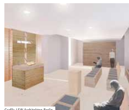
Grafik: LSW Architekten Berlin

Zunächst wurden gemeinsam die Vorgaben für die Architekturausschreibung erarbeitet. Ein freundlicher und heller Raum mit Platz für 50 Personen soll entstehen. Mit einem besonderen Highlight: eine Klagewand zur persönlichen und zurückgezogenen Andacht. Aus insgesamt vier Entwürfen wurde ein Vorschlag ausgewählt, der nun umgesetzt wird. Auch die Kunstkommission des Bistums Magdeburg war an der Auswahl beteiligt, schließlich werden in der Kapelle zukünftig Gottesdienste der Gemeinde St. Joseph aus