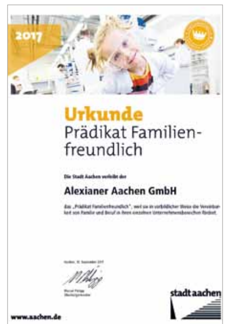
Die Alexianer Aachen GmbH erhielt das „Prädikat Familienfreundlich“ der Stadt Aachen 2017

Die Preisträger zeigten beispielhaft, wie Homeoffice, ein Eltern-Kind-Arbeitsplatz oder flexible Gleitzeiten den Spagat zwischen Familie und Beruf vereinfachen könnten und