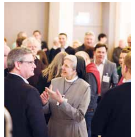
Alexianer-Führungskräfte kamen zum geistlichen Jahrestreffen zusammen