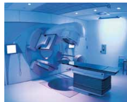
Linearbeschleuniger des MVZ Strahlentherapie

Die Strahlentherapie des Clemenshospitals ist wichtiger integrativer Bestandteil mehrerer von der Deutschen