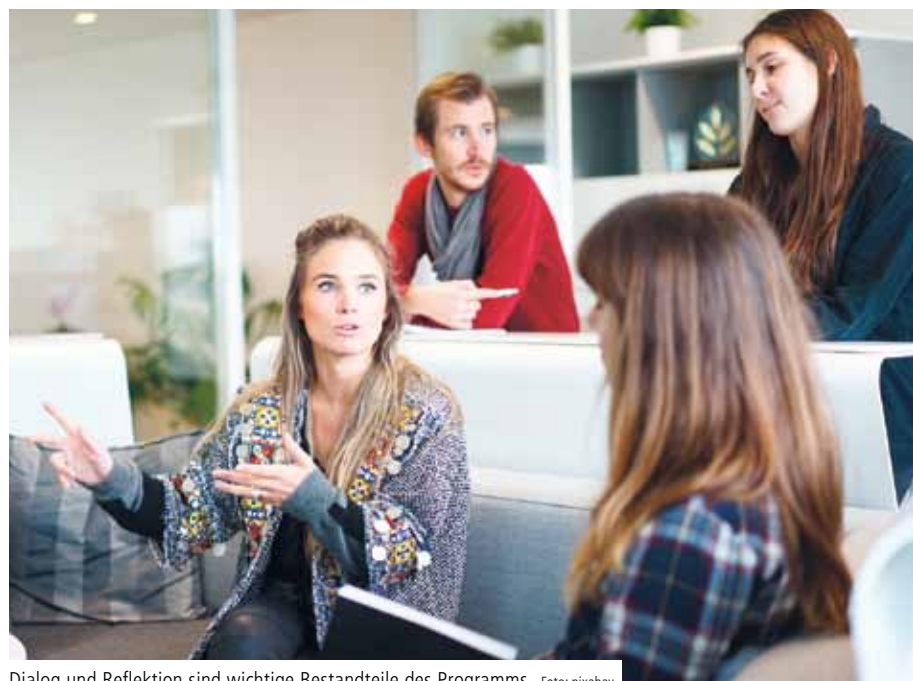
Dialog und Reflektion sind wichtige Bestandteile des Programms

Neu im Blick sind seit diesem Jahr junge Führungsnachwuchskräfte, die gezielt in die Führungsrollen hineinwachsen sollen und dabei unterstützt werden. Im Juni 2018 startet das erste Qualifizierungs- und Förderprogramm für den Alexianer-Führungsnachwuchs – mit zwölf Teilnehmerinnen und Teilnehmern verschiedener Berufsgruppen aus den zehn Alexianer-Regionen.