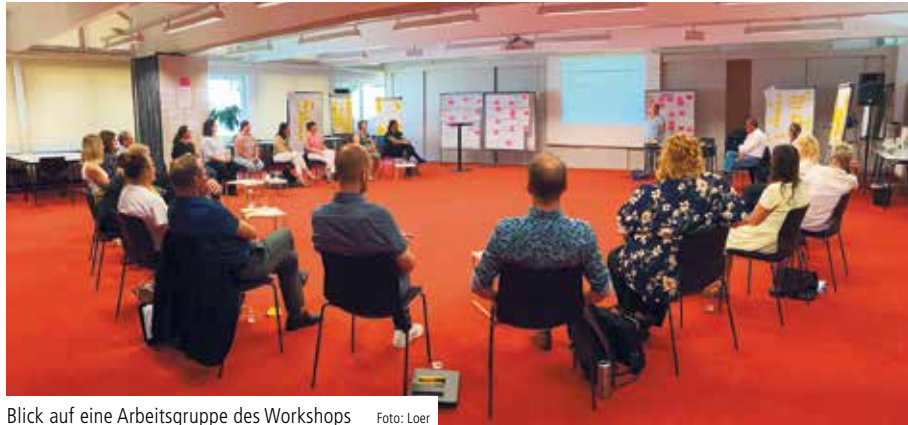
Blick auf eine Arbeitsgruppe des Workshops

Teilgenommen haben – abhängig vom Geschäftsfeld – Einrichtungs- und Pflegedienstleitungen, Mitglieder der Betriebsleitungen sowie ärztliche und pflegerische Mitarbeitende mit Führungsverantwortung, aber auch Mitarbeitende der Holding. Auffällig, jedoch wenig überraschend stand für jeden Geschäftsbereich das Thema Personal-