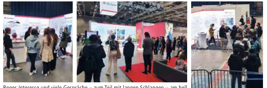
Reges Interesse und viele Gespräche – zum Teil mit langen Schlangen – am hell erleuchteten Messestand der Alexianer

Raum für zahlreiche Gespräche und viel Aufmerksamkeit