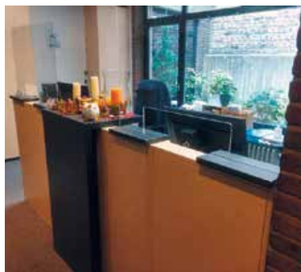
Blick in die Praxis in Aachen