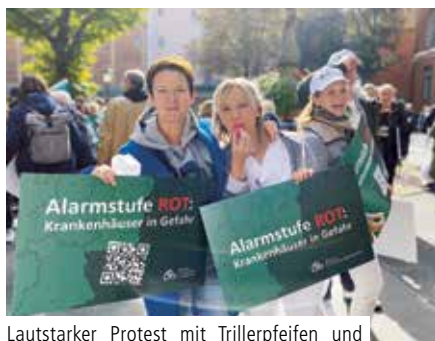
Lautstarker Protest mit Trillerpfeifen und Plakaten mit dem Motto „Alarmstufe ROT: Krankenhäuser in Gefahr“

Zum Abschluss dieser Kampagne fand eine Pressekonferenz der Berliner Krankenhausesgesellschaft (BKG)