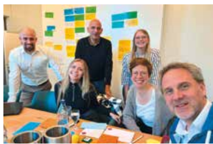
Das Kernprojektteam aus Unternehmenskommunikation und Softwareanbieter bei einem Workshop zur Einführung des Mitarbeiterportals

das neue Mitarbeiterportal des Alexianer-Verbundes