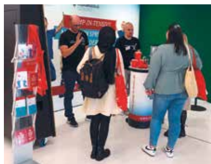
Der Messestand des Clemenshospitals und der Raphaelsklinik lockte viele Besucherinnen und Besucher an

Der Workshop „Ethische Fallvisite auf der Intensivstation“ bot dem Clemenshospital und der Raphaelsklinik, in diesem Jahr Gold-Partner des Kongresses, eine besondere Gelegenheit, mit Kolleginnen und Kollegen aus ganz Deutschland in Kontakt zu kommen. Doris Batke-Bonhoff,