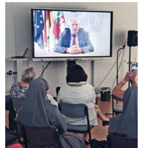
Minister Karl-Josef Laumann war per Videoschaltung in Krefeld dabei

Raphaelsklinik sowie Schwester Lucia Diebel, Teamleitung der Seelsorge, nutzten den Workshop, um auf diese Besonderheit der Kliniken aufmerksam zu machen. Am Messestand von Clemenshospital und Raphaelsklinik direkt im Eingangsbereich der Messe begeisterten Kolleginnen und Kollegen der Intensivstationen Besucherinnen und Besucher des Forums für die Themen Anästhesie, Intensivpflege, Pädiatrische Intensivpflege und OP-Pflege/OTA der beiden Häuser. ✕ (mb)