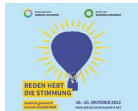
Bundesweit fanden über 400 Veranstaltungen von psychiatrischen und psychosozialen Einrichtungen statt

Bei den Alexianern Sachsen-Anhalt gaben die Alexianer Ambulanten Dienste den Auftakt zur Woche der Seelischen Gesundheit. Sie luden am 12. Oktober 2022 ins Psychosoziale Zentrum „Leuchtturm“ in Dessau zum Tag der offenen Tür ein. Patientinnen und Patienten sowie Mitarbeitende der Alexianer Klinik Bosse Wittenberg konnten am 13. Oktober 2022 das Theaterstück „Der schwarze Hund“ im Wittenberger Phönix-Theater sehen. Das Figurentheater klärte über die Erkrankung De-