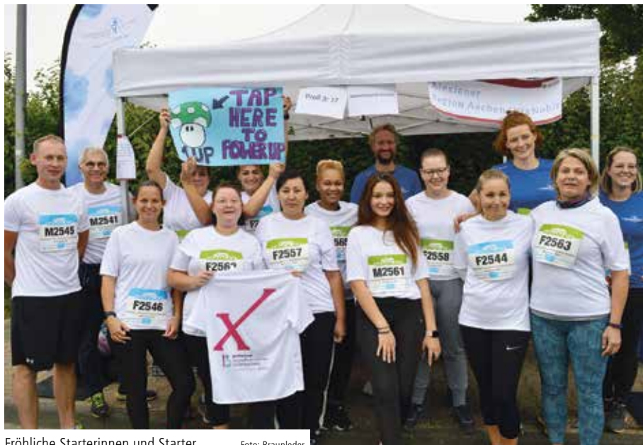
Fröhliche Starterinnen und Starter

„Der Aachener Firmenlauf ist immer eine tolle Veranstaltung! Stimmung und Atmosphäre sind phantastisch. Ein Sportevent, bei dem die Freude an der Bewegung und das Gefühl der Zusammengehörigkeit im Vordergrund stehen – und nicht in erster Linie der sportliche Ehrgeiz. Hier zählt jede sportliche Leistung – unabhängig von Runden und Zeiten“, erzählt