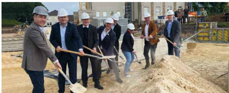
Bauherren, Mitarbeitende und Bauunternehmer beim Spatenstich

Der traditionsreiche Sandsteinbau in der Krankenhausstraße begrüßt Besucherinnen und Besucher sowie Patientinnen und Patienten zwar mit