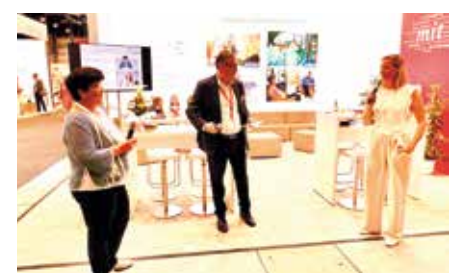
Claudia Moll (li.), Pflegebevollmächtigte der Bundesregierung beim Alexianer-Talk