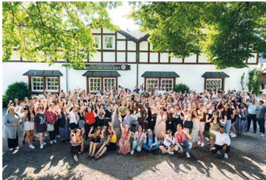
350 bestens gelaunte Pflegeschülerinnen und -schüler kamen zum Alexianer-Schülertag nach Arnsberg in die Alexianer-Region Klinikum Hochsauerland

350 Pflegeschülerinnen und Pflegeschüler trafen sich im Hochsauerland zum Schüler-Tag