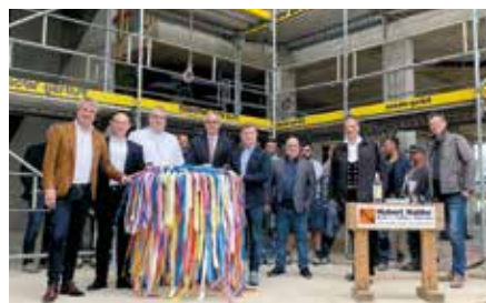
Richtfest in der neuen Zentralschule in Münster

Austausch und Kommunikation sein. Wir freuen uns sehr, wenn die neuen Räume im Sommer nächsten Jahres bezogen werden können.“