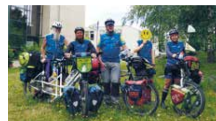
Im Juli 2022 besuchte ein Tandem-Team der „MUT-TOUR“ die Klinik Bosse in Wittenberg und das Psychosoziale Zentrum in Bitterfeld. Klientinnen und Klienten, Patientinnen und Patienten sowie Mitarbeitende tauschten sich mit den Teilnehmenden aus.

WITTENBERG. Bereits zum zehnten Mal bewegten sich in diesem Sommer hunderte Menschen mit und ohne Depressionserfahrung im Rahmen der „MUT-TOUR“ durch Deutschland, um ein Zeichen zu setzen für mehr Offenheit, Wissen und Mut im Umgang mit Depressionen. ✗