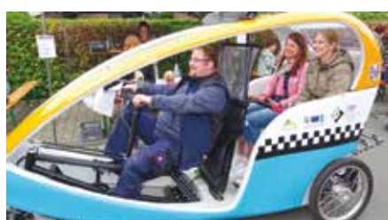
Die Gäste des Velotaxis hatten während der Probefahrt viel Spaß