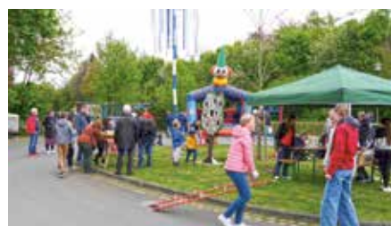
Buntes Treiben auf dem Frühlingsfest