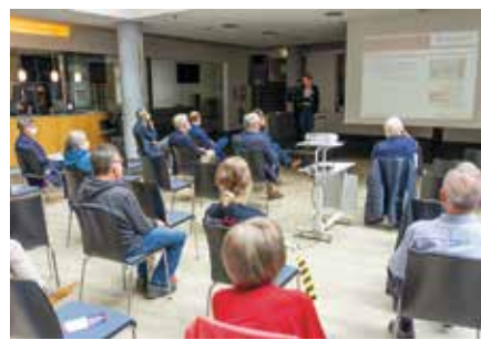
Erstmals seit Pandemiebeginn fand im Foyer der Raphaelsklinik wieder ein öffentlicher Infotag statt

konnten wir wieder eine öffentliche Informationsveranstaltung durchführen. Darüber freuen wir uns sehr, denn das persönliche Gespräch ist gerade bei solch sensiblen Themen durch nichts zu ersetzen“, sagten