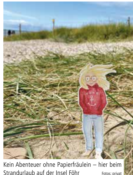
Kein Abenteuer ohne Papierfräulein – hier beim Strandurlaub auf der Insel Föhr

In der gelernten Kauffrau für Büromanagement und Hotelfachfrau, die seit Februar 2021 im Alexianer-Hotel am Wasserturm arbeitet, steckt ein kreativer Kopf, der die kleinen Glücksmomente des Alltags mit Zeichenblock, Polaroids und vielen bunten Farben festhält.