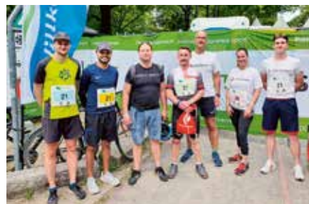
Das Team „Alexianer Akutaaufnahme“

um ihre Mitarbeiterinnen und Mitarbeiter gemeinsam in Bewegung zu bringen. Besonders sportlich zeigten sich dabei die Alexianer, die gleich mit mehreren Staffeln am Start waren.“ Insgesamt waren es 26 Teams mit je fünf Läuferinnen und Läufern aus dem St. Hedwig-Krankenhaus (SHK), Hedwigshöhe (KHH), dem St. Joseph-Krankenhaus (SJKW) sowie von Agamus und Alexianer Service GmbH. Besonderen Teamgeist bewiesen dabei diejenigen, die sich zuvor als Ersatzläuferinnen und -läufer angeboten hatten und spontan zum gemeinsamen Staffelteam „Alexianer Lauf Freunde“ zusammengefunden haben.