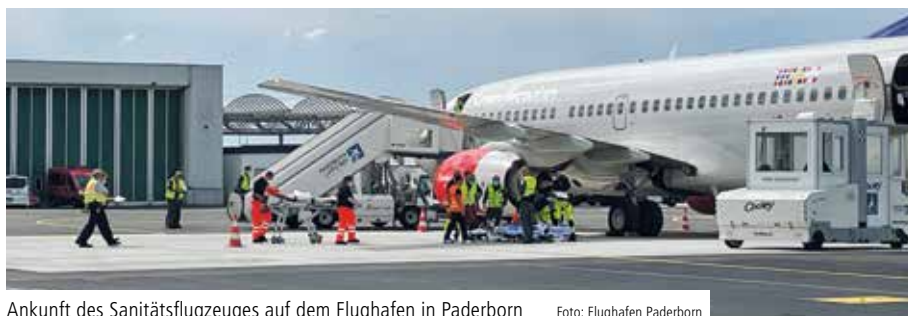
Ankunft des Sanitätsflugzeuges auf dem Flughafen in Paderborn

Verteilt nach dem sogenannten Kleeblattkonzept und koordiniert durch die Rettungsleitstellen der Kreise Paderborn und Hochsauerlandkreis wurden die Patientinnen und Patienten vom Flughafen in Paderborn mit Rettungs- und Krankentransportwagen nach Arnberg und Meschede transportiert. Die meisten hatten schwere Verletzungen durch den russischen Angriffskrieg erlitten. Alle hatten in ihrem