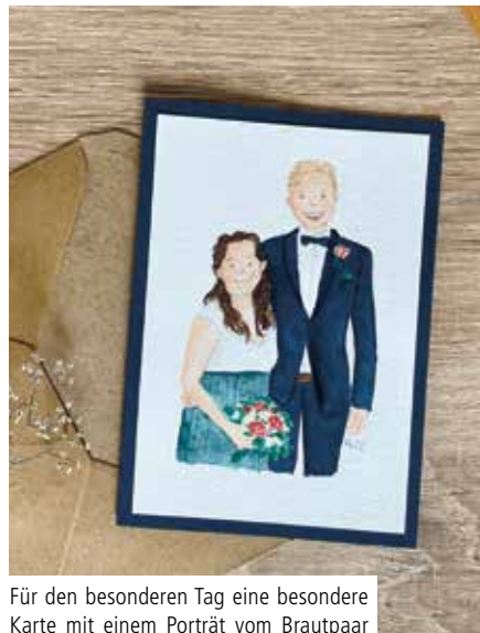
Für den besonderen Tag eine besondere Karte mit einem Porträt vom Brautpaar