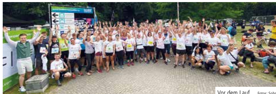
Vor dem Lauf

BERLIN. Am 17. Juni 2022 fand – nach zwei Jahren coronabedingter Zwangspause – wieder der dreitägige Teamstaffellauf im Berliner Tiergarten statt. Wie in den Jahren vor Corona zeigten sich die Mitlaufenden und Anfeuernden – bei hochsommerlichen Temperaturen – bestens aufgelegt. Und trotz der langen Unterbrechung ist den Läuferinnen und Läufern nicht die Luft ausgegangen.