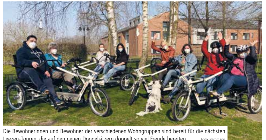
Die Bewohnerinnen und Bewohner der verschiedenen Wohngruppen sind bereit für die nächsten Leezen-Touren, die auf den neuen Doppelsitzern doppelt so viel Freude bereiten