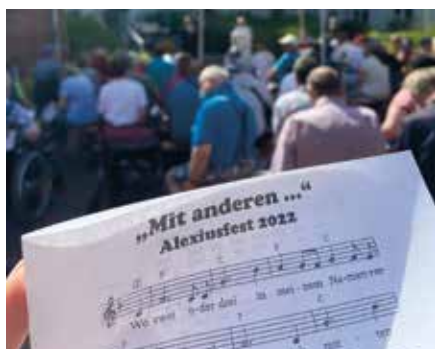
Immer wieder Miteinander

Mit dieser Botschaft wurde im Gedenken an den heiligen Alexius von Edessa der Gottesdienst gemeinsam mit Bewohnenden, Patientinnen und Pa-