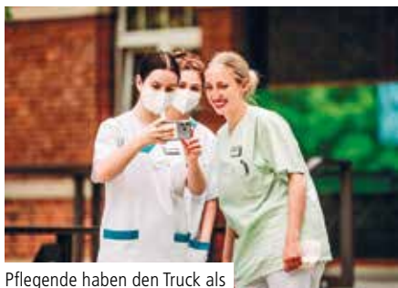
Pflegende haben den Truck als Fotomotiv entdeckt