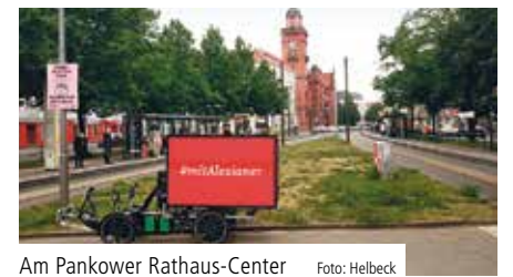
Am Pankower Rathaus-Center