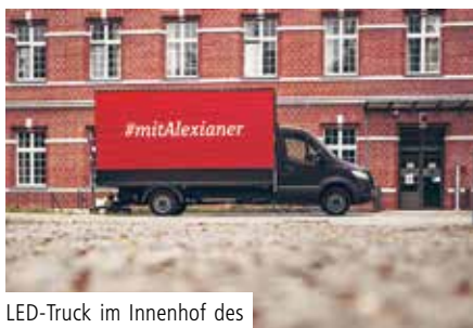
LED-Truck im Innenhof des Krankenhauses