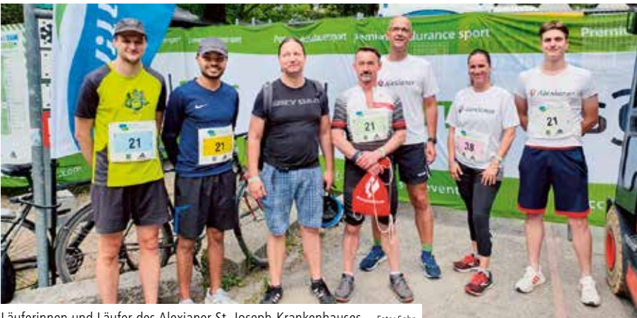
Läuferinnen und Läufer des Alexianer St. Joseph-Krankenhauses

Am 17. Juni 2022 um 18.30 Uhr fiel der Startschuss. Drei Jahre haben die Läuferinnen und Läufer des Alexianer St. Joseph-Krankenhauses, auch „Josi“ genannt, gewartet! Drei Jahre hieß es, Corona zu überstehen. Aber an diesem Freitag Mitte Juni hieß das gemeinsame Ziel: „5 x 5 km-Teamstaffel“, veranstaltet von den Berliner Wasserbetrieben.