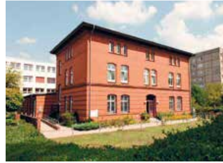
Tagesklinik Prenzlauer Berg St. Martha

Das Therapieziel besteht darin, in den aktuellen therapeutischen Bezie-