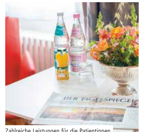
Zahlreiche Leistungen für die Patientinnen und Patienten