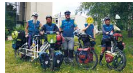
Im Juli 2022 besuchte ein Tandem-Team der „MUT-TOUR“ die Klinik Bosse in Wittenberg und das Psychosoziale Zentrum in Bitterfeld. Klientinnen und Klienten, Patientinnen und Patienten sowie Mitarbeitende tauschten sich mit den Teilnehmenden aus

WITTENBERG. Bereits zum zehnten Mal bewegten sich in diesem Sommer hunderte Menschen mit und ohne Depressionserfahrung im Rahmen der „MUT-TOUR“ durch Deutschland, um ein Zeichen zu setzen für mehr Offenheit, Wissen und Mut im Umgang mit Depressionen. x