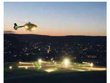
Covid-19-Patient des Universitätsklinikums Bochum auf dem Weg zum ECMO-Zentrum in Meschede. In Bochum gab es keine freien ECMO-Plätze mehr

als zertifiziertes ECMO-Zentrum ist das Haus in die überregionale Versorgung von Covid-Patienten eingebunden und hat auch beispielsweise bereits Patienten aus dem benachbarten Ausland übernommen. Die aufwendige ECMO-Therapie ist oft die letzte Behandlungsoption für die am härtesten vom Virus betroffenen Patienten. ECMO steht für extra-korporale Membranoxygenierung, sprich Sauerstoffversorgung des Blutes in einer Maschine außerhalb des Körpers, einer Art künstlicher