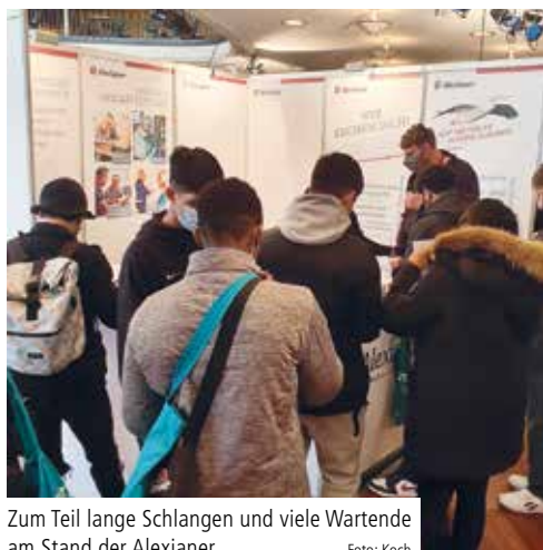
Zum Teil lange Schlangen und viele Wartende am Stand der Alexianer

Die zweitägige Messe im Palais am Funkturm war zur großen Freude aller zuvor skeptischen Aussteller sehr gut besucht. Am Stand der Alexianer wurden nahezu so viele Informations- und zum Teil Vorstellungsgespräche geführt wie selten zuvor. Auch das zentrale Bewerbungsmanagement