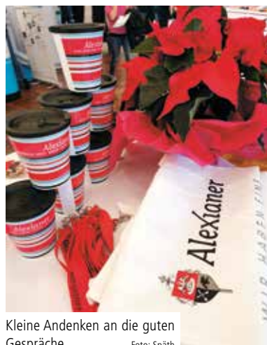
Kleine Andenken an die guten Gespräche

bekam im Anschluss an die beiden Messtage viel zu tun: Zahlreiche Bewerberinnen und Bewerber haben von der Teilnahme der Alexianer erfahren und ihre Bewerbung am Stand abgegeben. ✗ (tk)