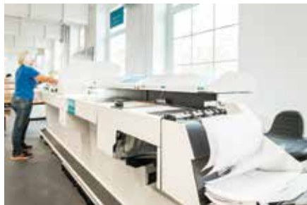
Rund 1,4 Millionen Dokumente täglich digitalisieren die Hochleistungsscanner

Viele Dokumente können heute digital erstellt und verwahrt werden. Und doch ist das Papier nicht ganz wegzudenken. Immer noch werden mitgebrachte Unterlagen, Ein- und Überweisungsscheine, Briefe, zu unterzeichnende Bögen und mehr pro Behandlungsfall in einer Akte gesammelt. Im Rahmen einer digitalen Zukunftsstrategie setzt das St. Joseph-Krankenhaus auf die elektronische Patientenakte. Daten aus dem Krankenhausinformationssystem Orbis sollen direkt in das digitale