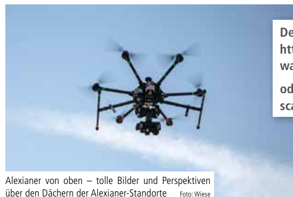
Alexianer von oben – tolle Bilder und Perspektiven über den Dächern der Alexianer-Standorte

So haben Sie die Standorte der Alexianer noch nie gesehen. Von Aachen über Krefeld nach Köln, weiter nach Berlin, Dessau und Wittenberg, zurück über Potsdam, Münster, Stolberg und Dernbach. Eine tolle Perspektive über den Alexianer-Dächern in elf Regionen, sechs Bundesländern und acht Bistümern. ✕