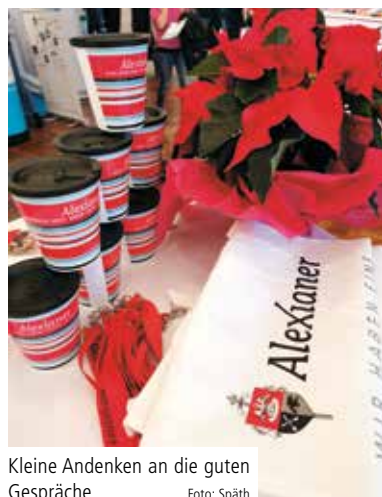
Kleine Andenken an die guten Gespräche

bekam im Anschluss an die beiden Messtage viel zu tun: Zahlreiche Bewerberinnen und Bewerber haben von der Teilnahme der Alexianer erfahren und ihre Bewerbung am Stand abgegeben. ✗ (tk)