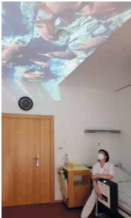
Das Qwiek.up – hier mit Unterwasserwelten an der Zimmerdecke – im Einsatz auf der Station St. Lukas (51)

Blumenwiesen und Unterwasserwelten bringen Orientierung und Beruhigung