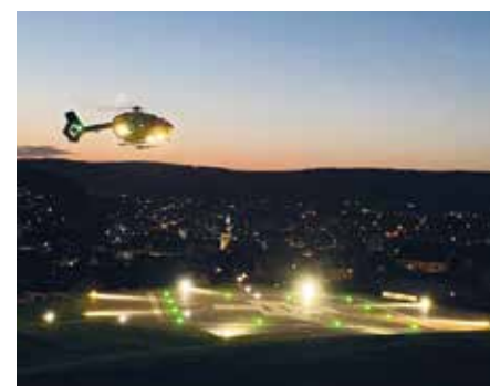
Covid-19-Patient des Universitätsklinikums Bochum auf dem Weg zum ECMO-Zentrum in Meschede. In Bochum gab es keine freien ECMO-Plätze mehr

als zertifiziertes ECMO-Zentrum ist das Haus in die überregionale Versorgung von Covid-Patienten eingebunden und hat auch beispielsweise bereits Patienten aus dem benachbarten Ausland übernommen. Die aufwendige ECMO-Therapie ist oft die letzte Behandlungsoption für die am härtesten vom Virus betroffenen Patienten. ECMO steht für extra-korporale Membranoxygenierung, sprich Sauerstoffversorgung des Blutes in einer Maschine außerhalb des Körpers, einer Art künstlicher