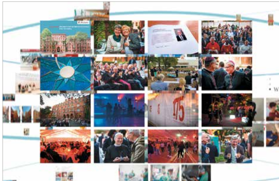
Screenshots der digitalen Neujahrsansprache

Rückblick auf Vergangenes – Ausblick auf Kommdendes