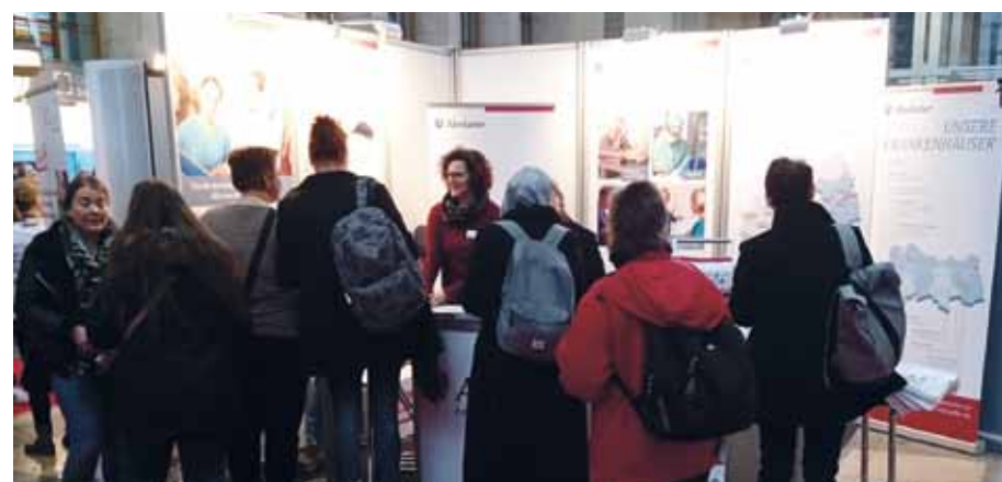
Ende November waren die Alexianer wieder mit einem Stand, exklusiv und unmittelbar an erster Stelle des langen roten Teppichs, auf der JobMedi in Berlin vertreten. Zur zweitägigen Veranstaltung strömten tausende Besucher und alle hatten direkt am Eingang ins Blick: die Alexianer