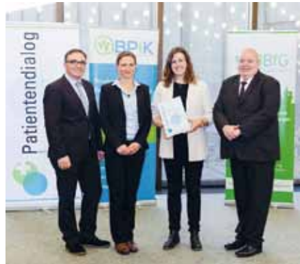
Platz drei für die Christophorus Klinik: Preisverleihung beim Award Patientendialog

Sieger im zum zweiten Mal verliehenen Award Patientendialog wurde das St. Elisabeth-Krankenhaus Köln-Ho-