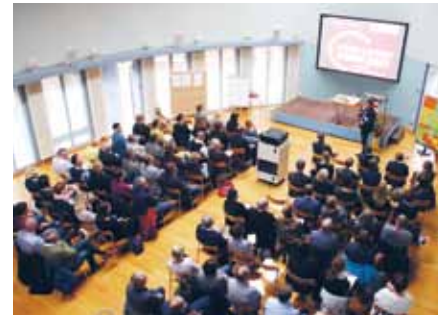
Volles Haus und gespannte Blicke bei der Zukunftswerkstatt Bildung und Pflege in Berlin

Seit 2014 widmen sich die Alexianer in der Zukunftswerkstatt innovativen Gesundheitsthemen und den Herausforderungen einer modernen Pflege. Diese Veranstaltung vermittelt zum einen modernes Wissen und fördert zum anderen den Austausch zwischen Experten und Führungskräften. „Wir wollen die Innovationstreiber der Pflege identifizieren und in unseren Arbeitsalltag integrieren“, so