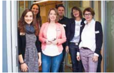
Inklusionsexperten: Die Mitarbeiter der neuen Beratungsstelle „Alexianer 360°“ im Zentrum Kölns.

KÖLN. Die Alexianer Werkstätten GmbH eröffnete Ende vergangenen Jahres gemeinsam mit der Alexianer Köln GmbH ihre neue Beratungsstelle mit dem Namen „Alexianer 360°“ im Herzen der Domstadt.