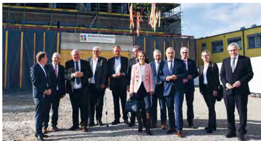
Im Beisein von Gesundheitsminister Laumann (3. v. l.) und weiteren Ehrengästen wurde das Richtfest gefeiert

Für die Menschen im Hochsauerlandkreis (HSK) bedeutet das 88-Millionen-Projekt eine Verbesserung der medizinischen Versorgung. Denn bisher gibt es im HSK und weit darüber hinaus kein Krankenhaus, das so viele Fachabteilungen und Kompetenzen in sich vereint, dass eine umfassende