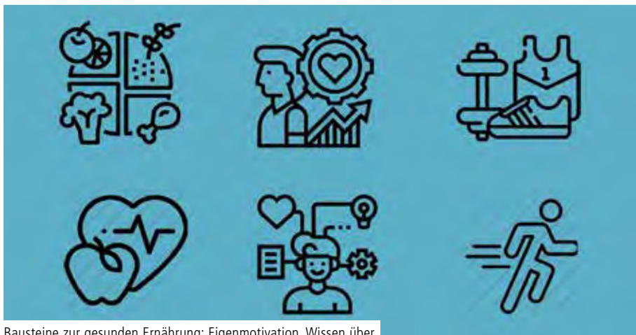
Bausteine zur gesunden Ernährung: Eigenmotivation, Wissen über Nahrungsmittel, Bewegung und tatsächliche Ernährung Grafik: Höse

Stefanie Amler unterstützt Patientinnen und Patienten zur gesunden Ernährung