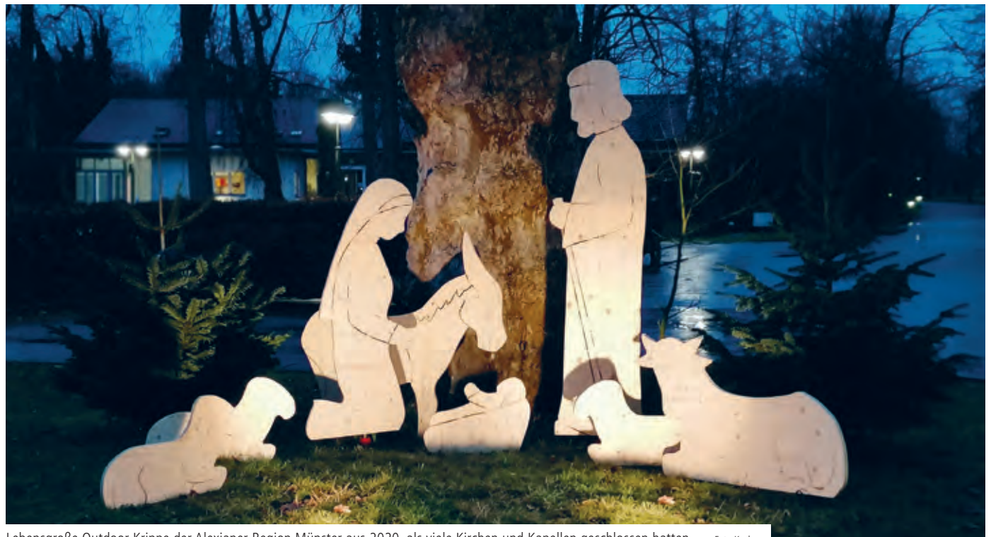
Lebensgroße Outdoor-Krippe der Alexianer-Region Münster aus 2020, als viele Kirchen und Kapellen geschlossen hatten

Beim Strategieprozess 2025 hat die Umsetzung begonnen. Die Alexianer haben sich mit Beginn des Jahres strukturell neu aufgestellt: In den obersten beiden Gremien – Stiftungskuratorium und Aufsichtsrat – haben wir neue Mitglieder begrüßen dürfen. Die Führungsstruktur des Unternehmens wurde durch die Erweiterung der Hauptgeschäftsführung und die