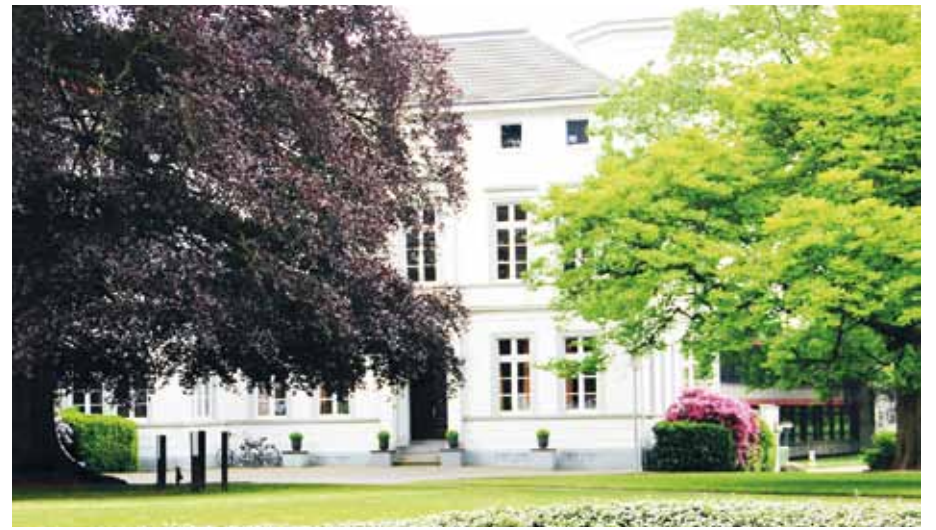
Die Liebfrauenschule Mülhausen: gegründet 1888 von den Schwestern Unserer Lieben Frau