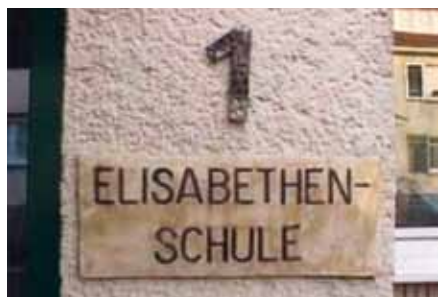
Für viele die Nummer eins: Eingangsschild des „Eli“

Für eine exakte Befundung hält das MVZ mit Röntgentechnik, Computertomografie (CT), Magnetresonanztomografie (MRT) sowie MR-Angiografie modernste Bildgebungsverfahren vor. ✕ (sm)