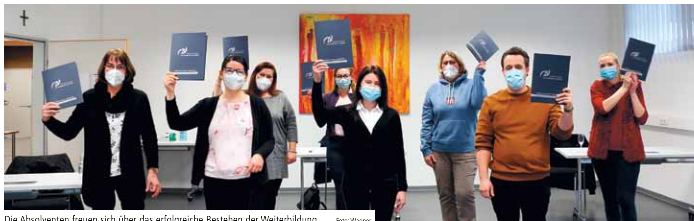
Die Absolventen freuen sich über das erfolgreiche Bestehen der Weiterbildung

komplett verzichtet werden. Die Katharina Kasper Akademie bietet diese Weiterbildung in einem jährlichen Turnus an. Die Weiterbildungsbezeichnung wird in Rheinland-Pfalz aufgrund staatlicher Regelung erworben und darf auch in anderen Ländern der Bundesrepublik geführt werden. ✓ (tw)