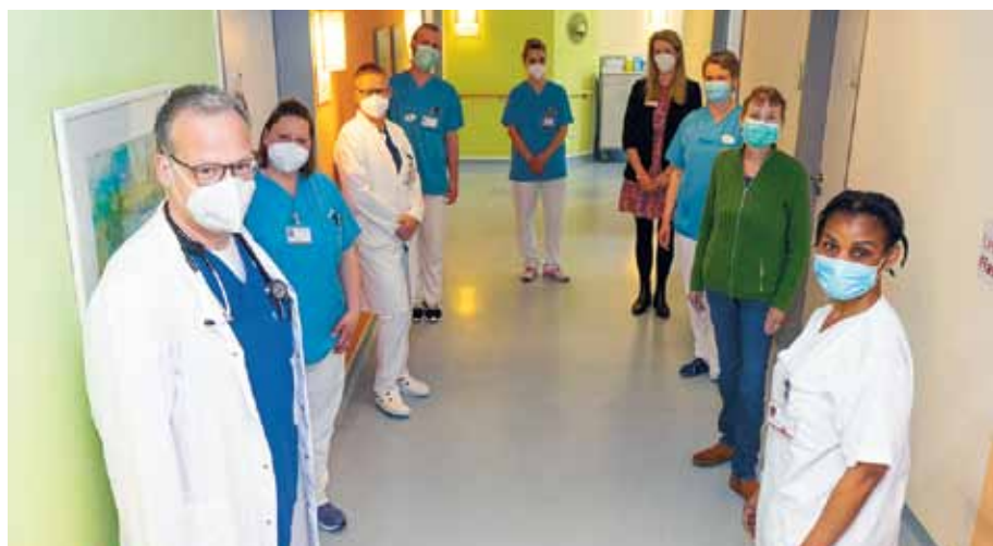
Auf der Palliativstation der Raphaelsklinik arbeiten Pflege, Medizin, Therapie und externe Organisationen Hand in Hand

MÜNSTER. Im April 2011 wurde die Versorgung von Palliativpatienten der Raphaelsklinik mit zunächst vier Betten aufgenommen. Heute verfügt die eigenständige Palliativstation über elf Betten und versorgt über 300 Patienten pro Jahr. Die Experten der Raphaelsklinik betonen, dass das Bild einer Endstation im Zusammenhang mit der Palliativstation falsch sei, vielmehr gehe es