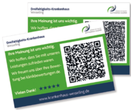
Bewertungskärtchen im Einsatz