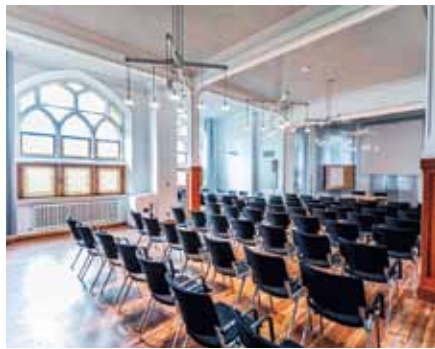
Historischer Seminarraum Katharina Kasper

Firmenkunden profitieren von den Beratungsleistungen der DGKK Dienstleistung GmbH sowie von der Mög-